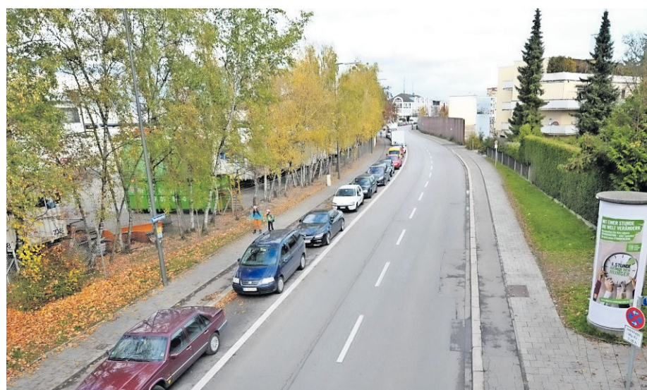
Umstrittene Route: Statt durch die Netzerstraße soll der 51er Bus künftig durch die Baubergerstraße – hier im Bild – rollen.

Fußweg zur neuen Haltestelle nur „um wenige Meter verlängern“. Anwohner im Bereich der Netzer- und Zügel- sowie der Warschauer Straße sehen das jedoch anders. Im angenommenen Antrag aus der Bürgerversammlung ist von einem immer-